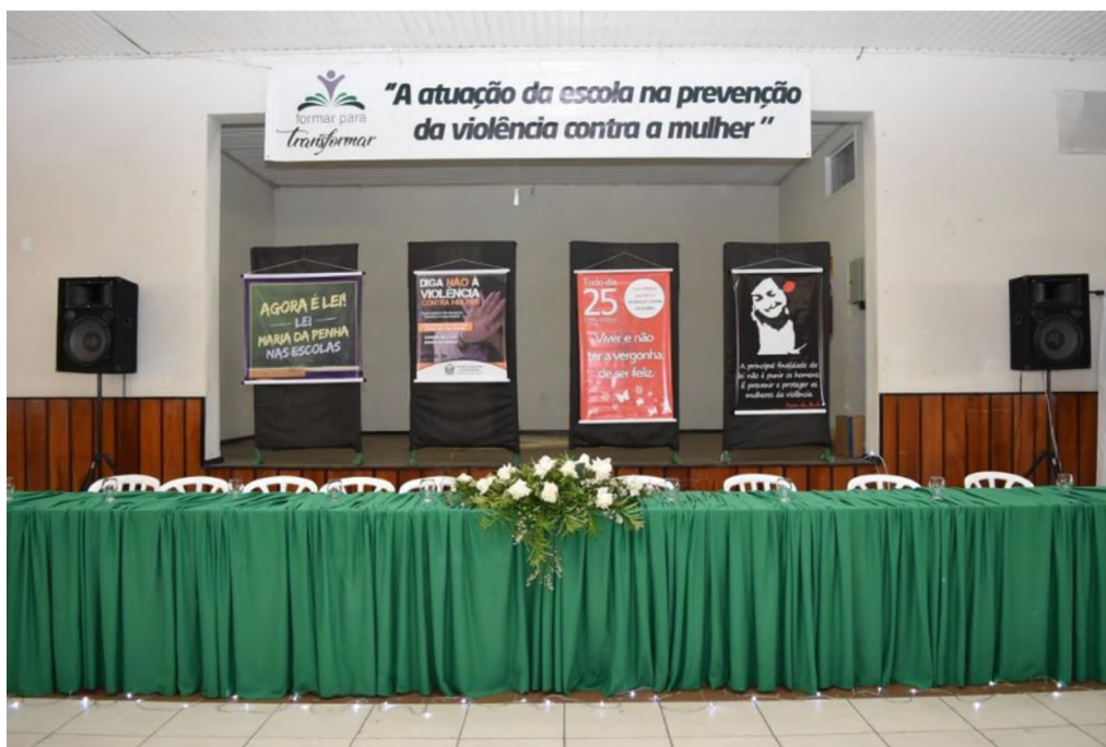
Foto 2 - Decoração do salão do evento