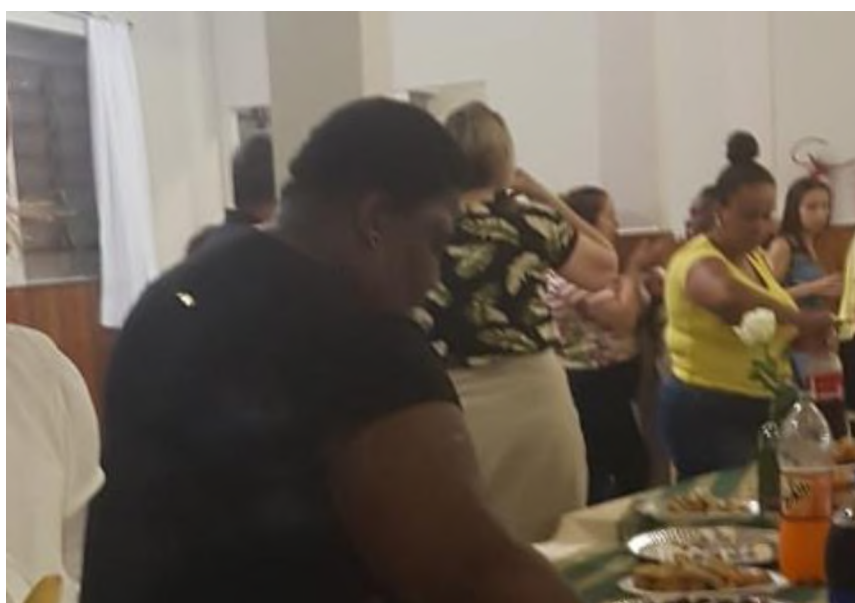
Foto 10 - Coquetel de boas-vindas