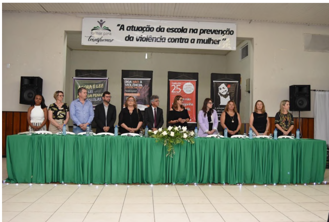
Foto 4 - Solenidade de Abertura