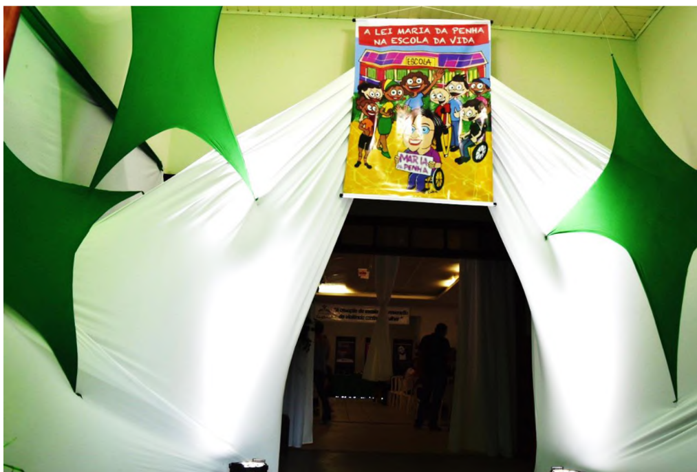
Foto 1 - Decoração da entrada principal

Trata-se de realização de projeto-piloto do curso Formar para Transformar, realizado nos dias 21 e 22 de novembro de 2018, no município de Siderópolis, na modalidade presencial, no Siderópolis Clube, com carga horária de 9 (nove) horas-aula.