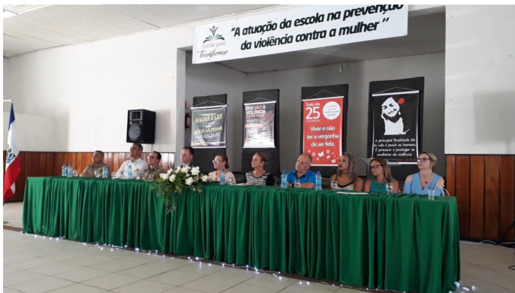
Foto 15 - Roda de Conversas

Após breve intervalo, deu-se início à Roda de Conversas, com a participação de autoridades e membros da rede, momento em que os presentes tiveram oportunidade de debater e de apresentar os serviços disponíveis na rede de apoio e proteção à mulher de Siderópolis.