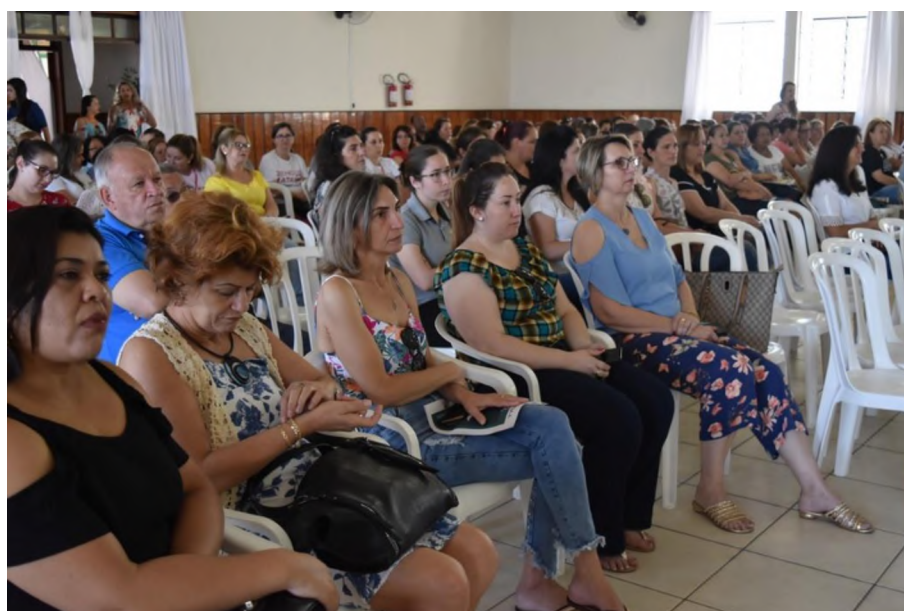
Foto 12 - Público no dia 22-11-2018