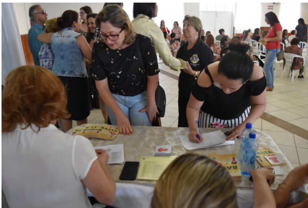
Foto 3 - Registro de presenças

No dia 21-11-2018 , a partir das 18 horas, deu-se início ao registro de presença dos participantes.