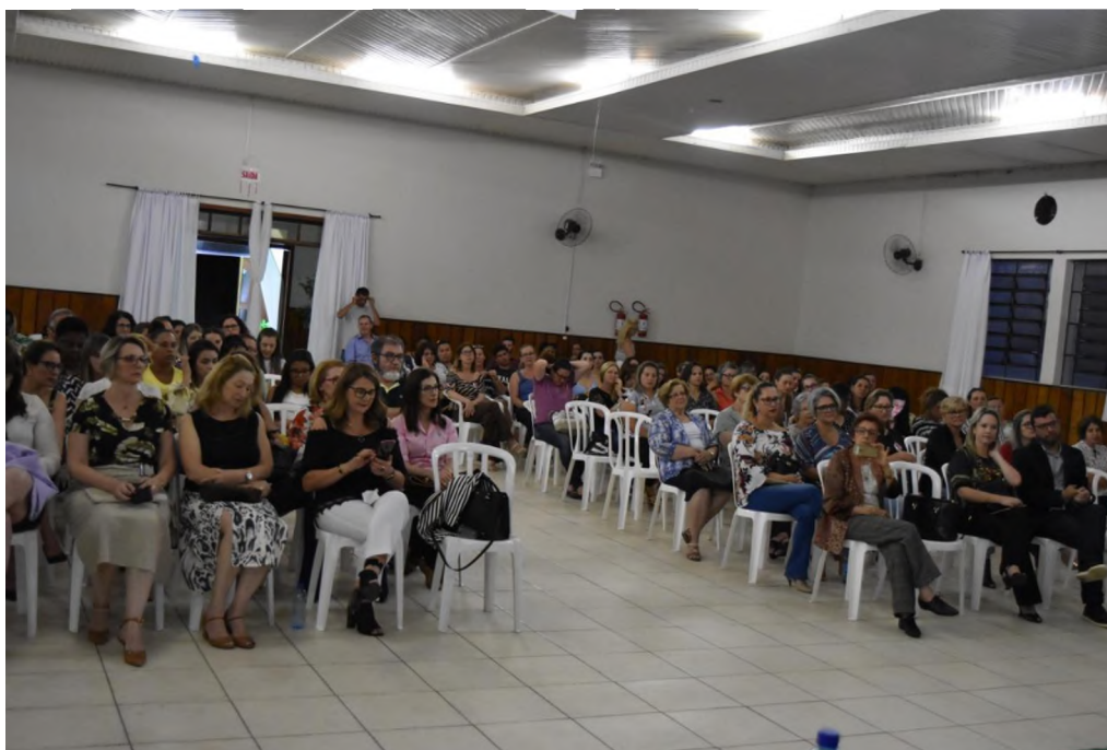
Foto 7 - Geral do público na noite do dia 21-11-2018