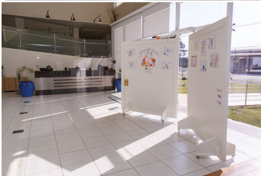
Foto3: Hall de entrada do Fórum e Câmara de Vereadores

https://www.tjsc.jus.br/web/imprensa/-/no-combate-a-violencia-de-genero-pjsc-esta-engajado-no-programa-justica-pela-paz-em-casa?redirect=%2Fweb