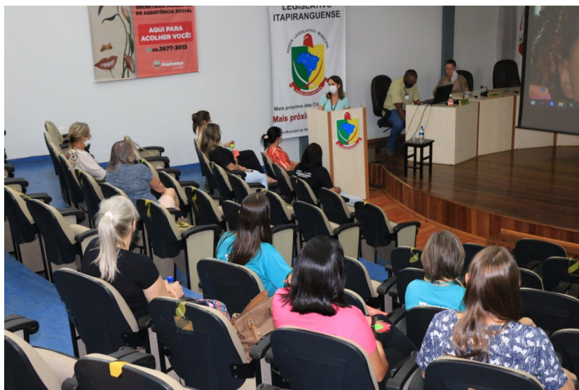
Foto3: Público das palestras