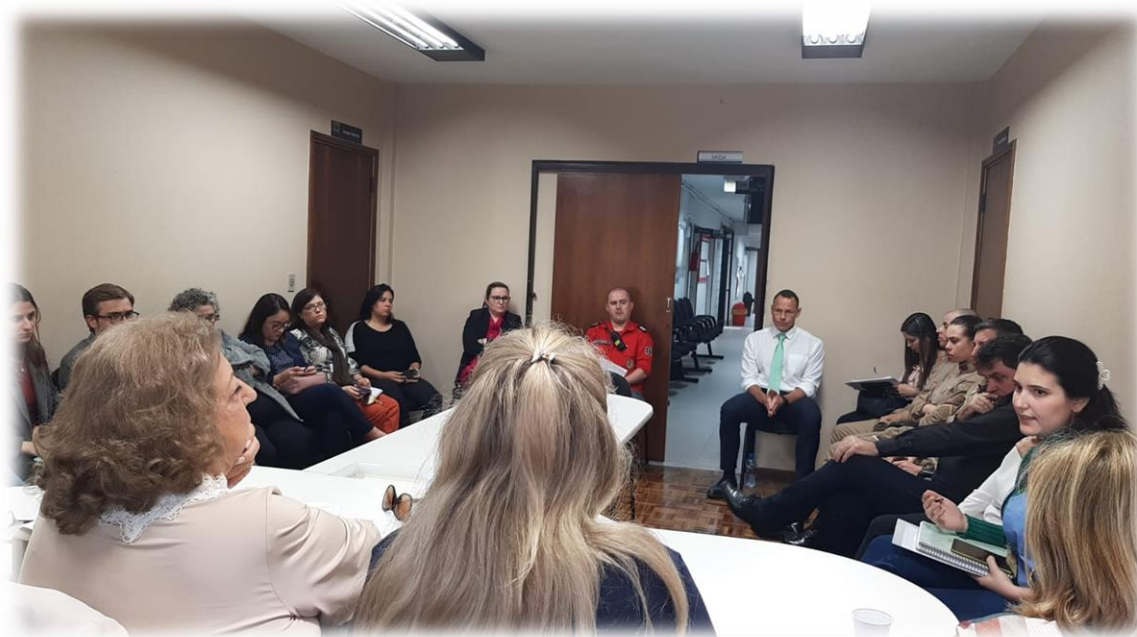
Imagem 2: reunião com a rede de atendimento

A cerimônia de abertura do evento “Formar para Transformar” ocorreu no dia 15 de setembro, às 17h30, com a apresentação teatral da companhia Trapos e Farrapos, sobre Relacionamento Abusivo, e com a presença de diversas autoridades locais.