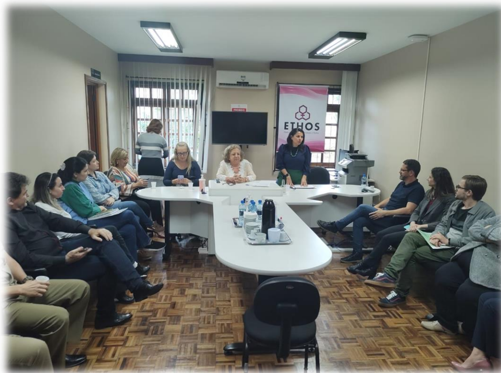
Imagem 1: Reunião com a rede de atendimento de Indaial

Foi realizado, no dia 15, às 14h, nas dependências do Fórum de Indaial reunião com a rede de atendimento e proteção da comarca, atividade relacionada ao projeto Ethos.