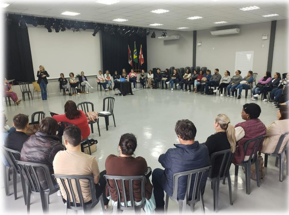
Imagem 11: roda de conversa