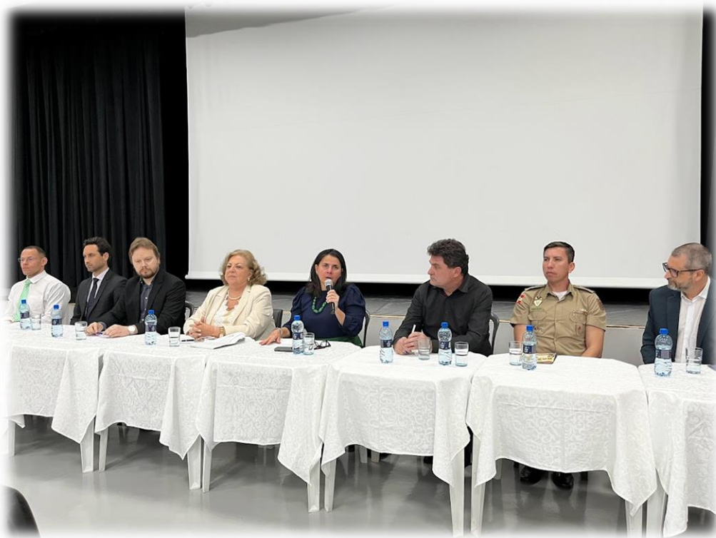
Imagem 4: mesa de autoridades