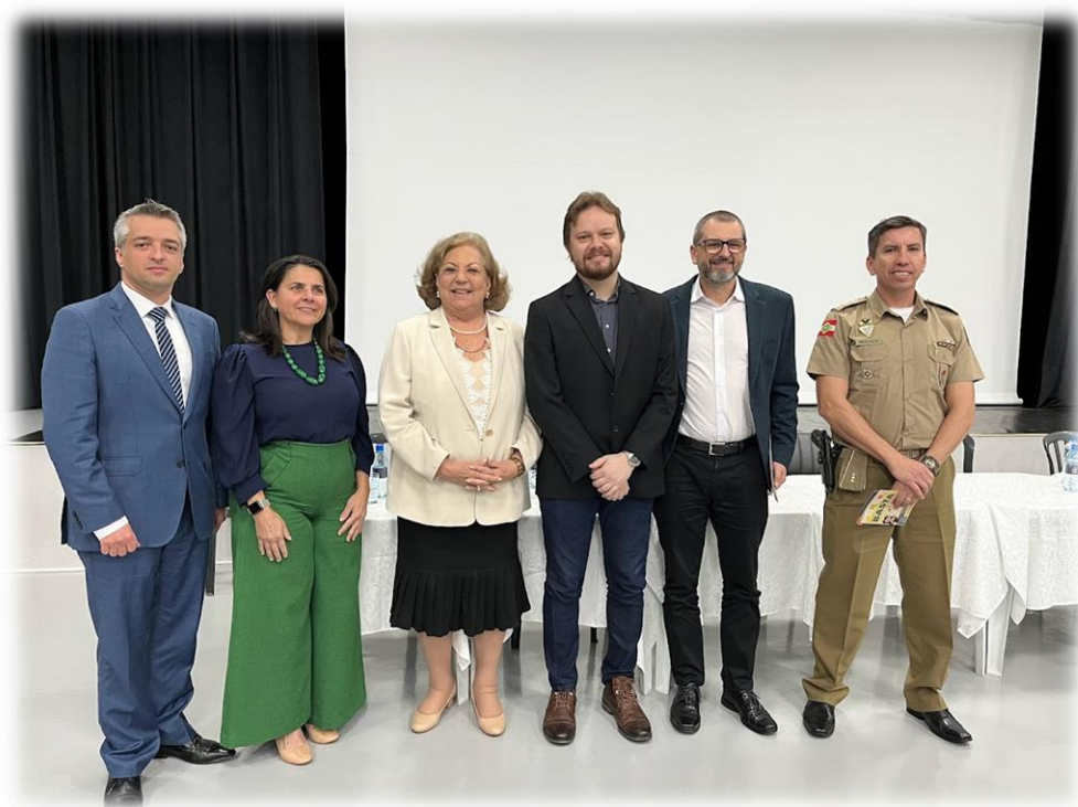
Imagem 6: mesa autoridades