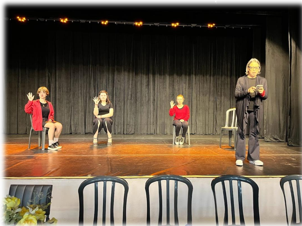
Imagem 3: apresentação cultural

A cerimônia de abertura do evento “Formar para Transformar” ocorreu no dia 15 de setembro, às 17h30, com a apresentação teatral da companhia Trapos e Farrapos, sobre Relacionamento Abusivo, e com a presença de diversas autoridades locais.