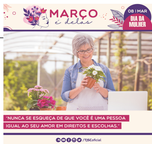
Card 2 – enviado dia 17 de março