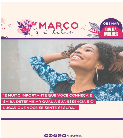
Card 3 – enviado dia 24 de março