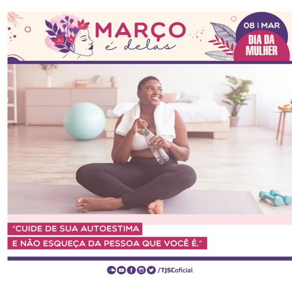
Card 4 – enviado dia 31 de março

Além disso, a página da campanha foi atualizada com as informações referentes às atividades do ano de 2023: https://www.tjsc.jus.br/web/violencia-contra-a-mulher/campanhas/marco-e-delas .