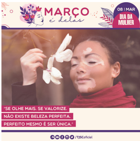
Card 1 – enviado dia 10 de março