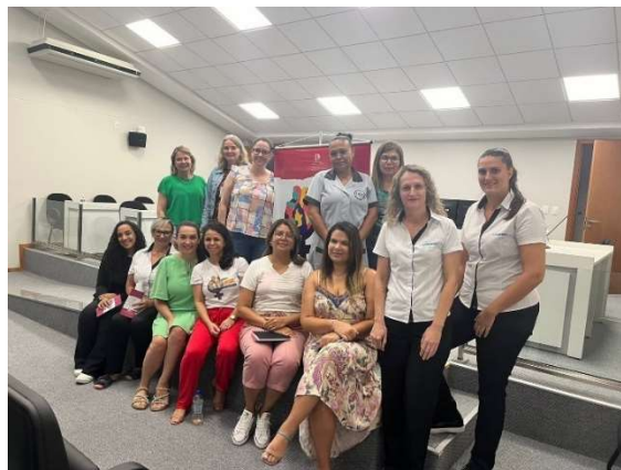
Foto 09 e 10: Roda de Conversa do Indira na Comarca de Rio do Sul

Na sequência, em 22 de março, a Campanha esteve na Comarca de Imaruí, apresentando a Cartilha da lei Maria da Penha traduzida para a língua Guarani para mulheres e lideranças da aldeia Tekoa Marangatu. Sendo importante mencionar que durante todo o processo de elaboração dessa cartilha o protagonismo foi das mulheres indígenas.