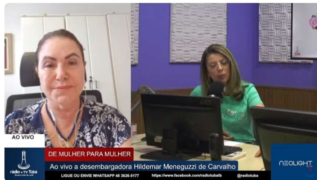
De Mulher para Mulher - 25/03/2024