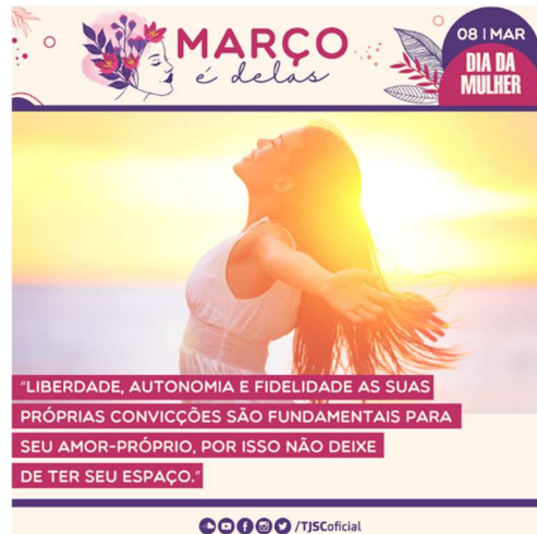
Card 2 – enviado dia 14 de março