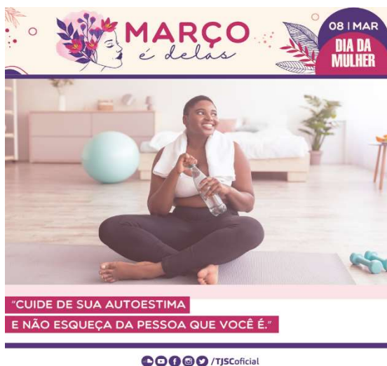
Card 3 – enviado dia 21 de março

Além disso, a página da campanha foi atualizada com as informações referentes às atividades de 2024: https://www.tjsc.jus.br/web/violencia-contra-a-mulher/campanhas/marco-e-delas .