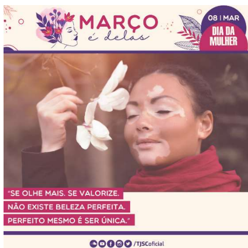
Card 1 – enviado dia 07 de março

A fim de incentivar a participação das comarcas, foram enviadas mensagens a todos (as) os(as) magistrados(as) e servidores(as) do Tribunal, via e-mail institucional, nos dias 07, 14 e 21 de março de 2024: