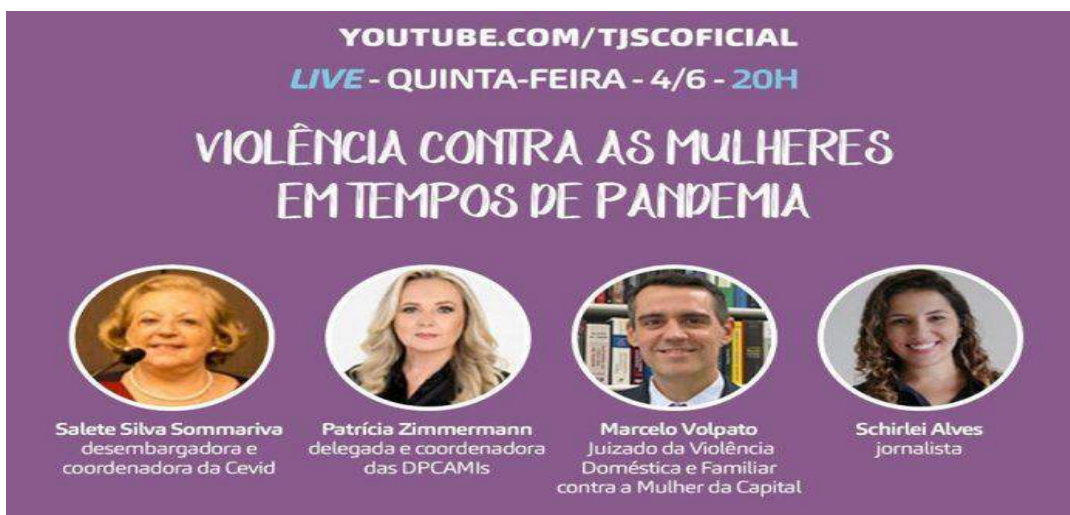
Figura 27 – Live Violência contra as Mulheres em Tempos de Pandemia

04-6, 20h - Live Violência contra as mulheres em tempos de pandemia – canal oficial do TJSC