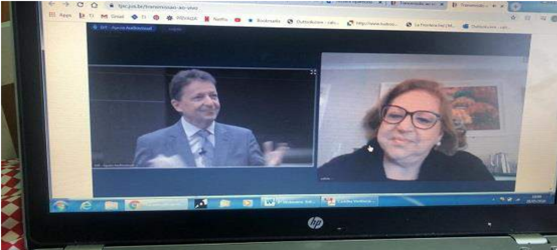
Figura 26- Programa Palavra do Presidente