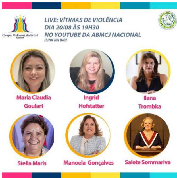
Figura 35 - Live Vítimas de Violência

25-8, 16h - Live Questões de álcool e drogas,- Formar par aTransformar 11-9, 14h - Roda de conversas sobre Violência Doméstica - Fecam 24-9, 20h - Palestra Unoesc (Tema: Proteção das mulheres frente a violência e abusos sofridos)