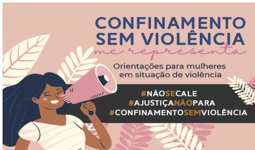
Figura 18 - Identidade Visual do Projeto

A declaração pública de pandemia em relação ao Covid-19, de 11 de março de 2020, da Organização Mundial da Saúde (OMS), e o Decreto Legislativo no 6, de 20 de março de 2020, que declarou a existência de estado de calamidade pública no