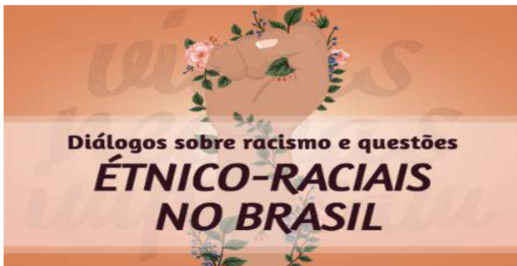
Figura 17 - Identidade Visual do Projeto

A Coordenadoria da Mulher em Situação de Violência Doméstica e Familiar - Cevid entende que a construção de uma sociedade mais justa passa pela erradicação do racismo. No sentido de contribuir para o combate desta forma de discriminação social, foi promovido o webinar "Diálogos sobre racismo e questões