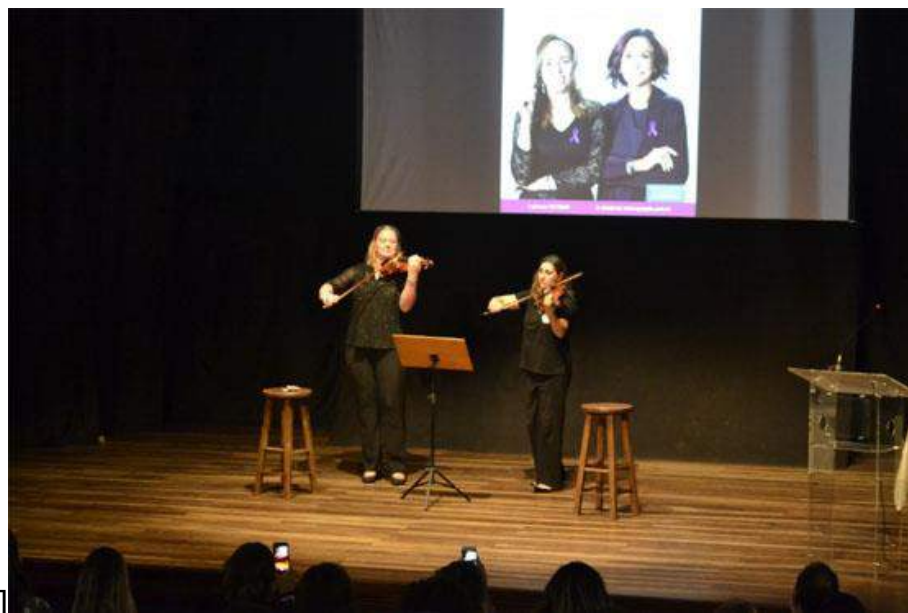
Figura 2 – 16ª Semana da Justiça pela Paz em Casa (comarca de Blumenau)