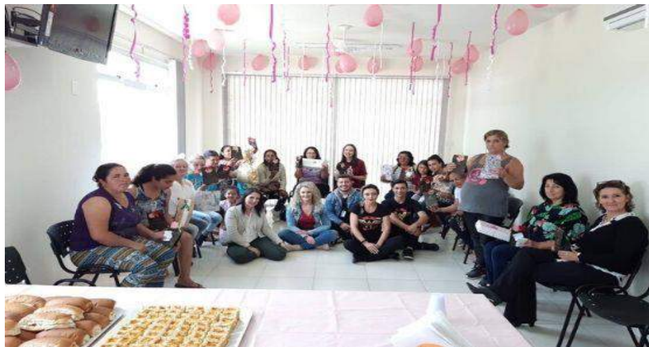
Figura 5 – 16ª Semana da Justiça pela Paz em Casa (comarca de Itaiópolis/Papanduva)