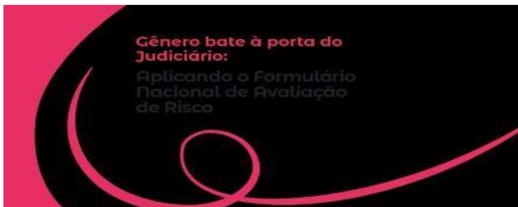
Figura 16 - Identidade Visual do Projeto