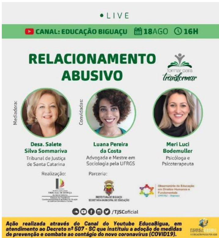
Figura 34 - Live Relacionamento Abusivo

20-8, 19h - Live “Vítimas de Violência” com Mulheres do Brasil, sobre o projeto da Ilana Tronbka (vagas para vítimas de VD)