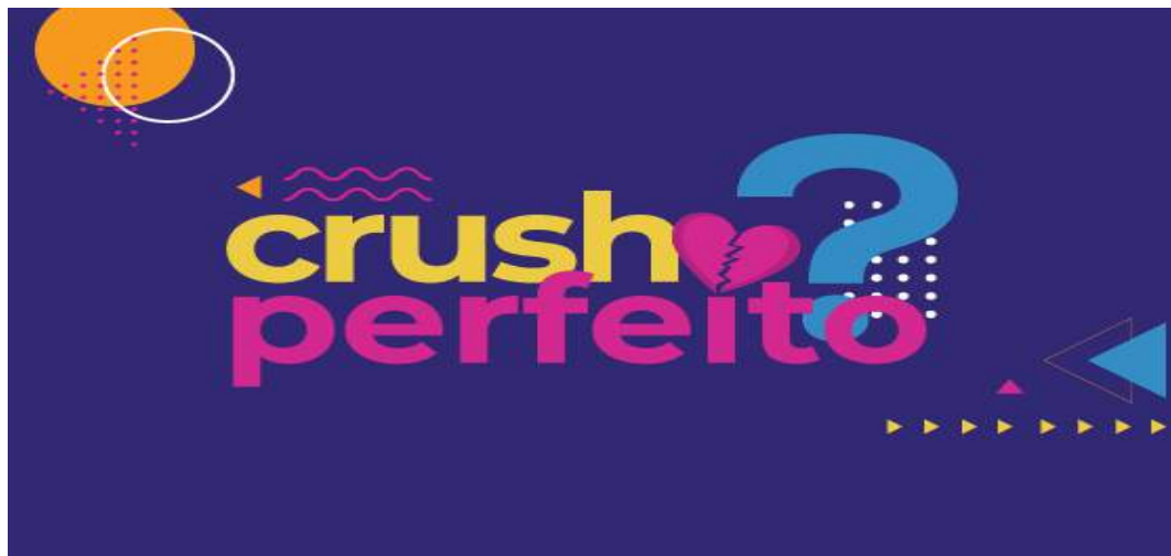
Figura 19 - Identidade Visual do Projeto