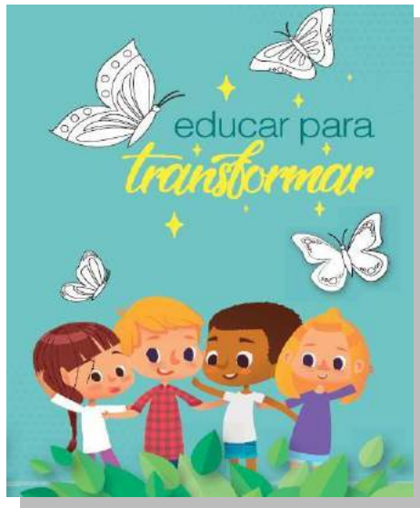
Figura 23 – Educar para Transformar