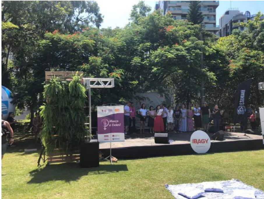
Figura 10 - Participação no evento Março é Delas

No domingo (8/3), também prestigiou a abertura do Mês da Mulher no Parque da Luz, localizado na cabeceira insular da recém-reaberta ponte Hercílio Luz.