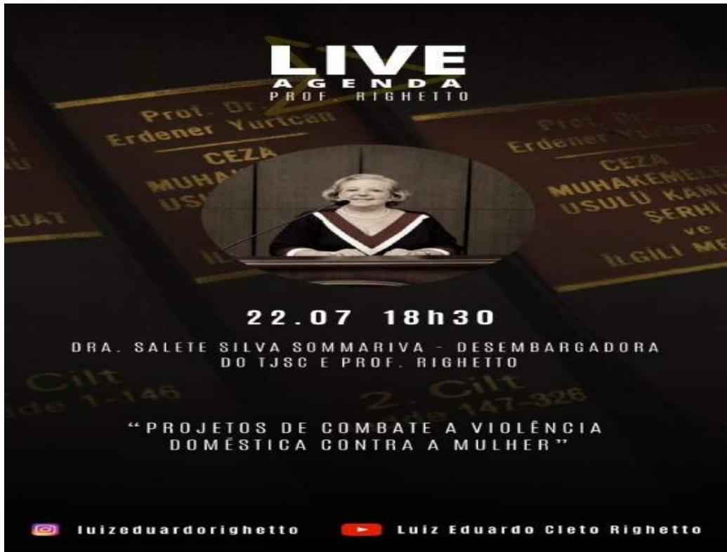
Figura 28 - Live Projetos de Combate a Violência Doméstica contra a Mulher

23-7, 19h - Encerramento do webinar Diálogos sobre racismo e questões étnico-raciais no Brasil