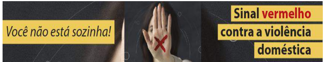
Figura 20 - Identidade Visual do Projeto

O fundamental isolamento social, recomendado pela Organização Mundial de Saúde (OMS) e regulamentado nos Estados e no Distrito Federal, tem por objetivo restringir atividades a fim de evitar a propagação do coronavírus, contudo esse convívio doméstico mais intenso tem feito aumentar os casos de violência e, ao mesmo tempo, dificultado a busca por auxílio, o que pode ser um motivo de subnotificação.