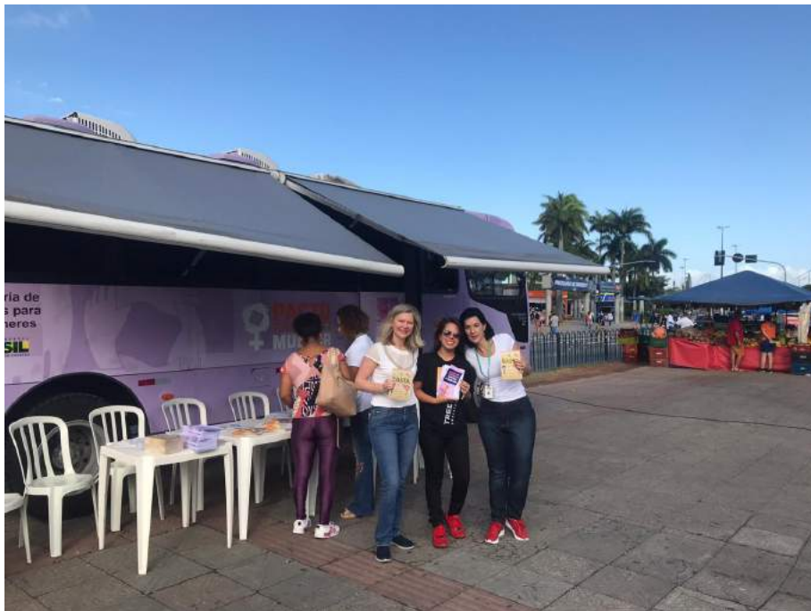
Figura 9 - Ação da Secretaria de Desenvolvimento Social no Ticen, com distribuição das cartilhas da Cevid