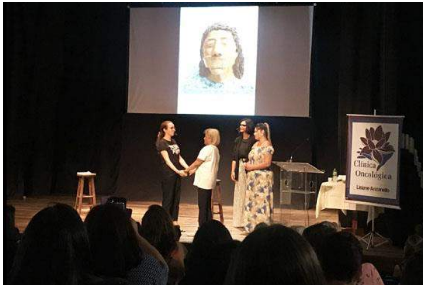
Figura 1 – 16ª. Semana da Justiça pela Paz em Casa (comarca de Blumenau)