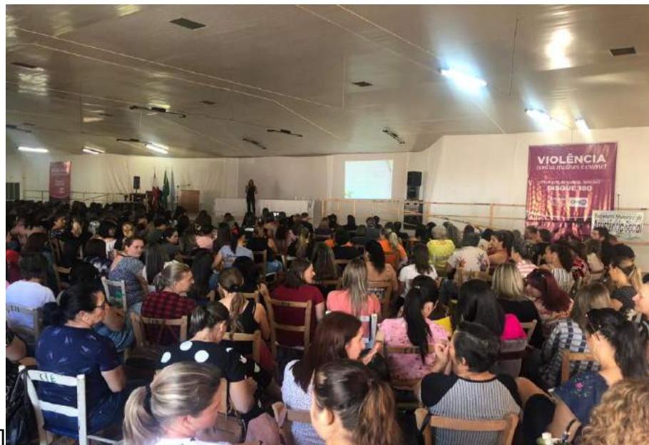
Figura 2 - Curso Formar pela Transformar de Palmitos - Público