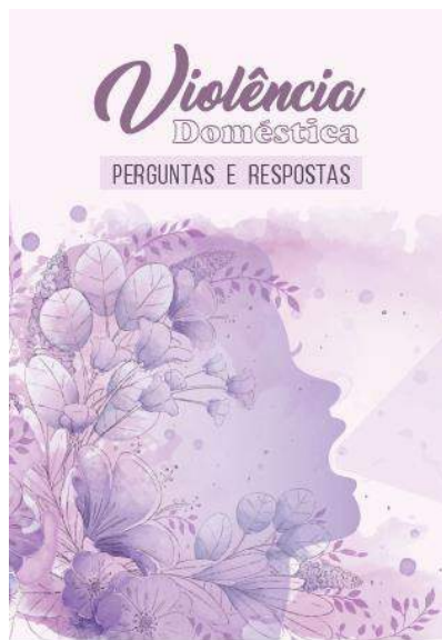
Figura 22 - Violência Doméstica: Perguntas e Respostas

Disponível nas versões impressa, em libras e digital e, estas últimas disponíveis em: Cartilha "Violência doméstica: perguntas e respostas" .