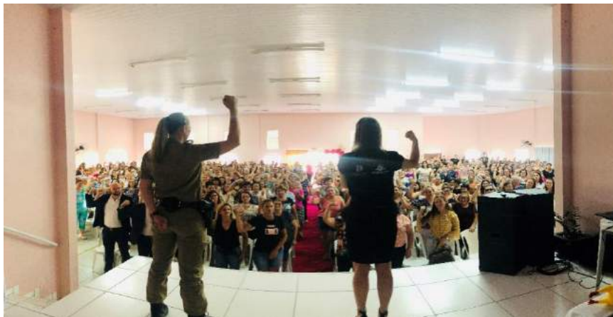
Figura 7 – 16ª Semana da Justiça pela Paz em Casa (comarca de Rio do Campo)