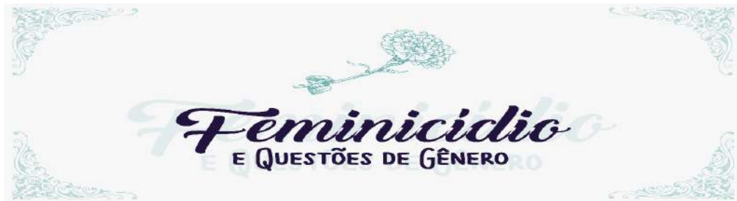
Figura 15 - Identidade Visual do Projeto

No ano de 2020, foi disponibilizada a 4ª edição do curso “Feminicídio e Questões de Gênero”, que contou com a participação de 300 pessoas, no período de 1º a 28 de junho no ambiente virtual da Academia Judicial.