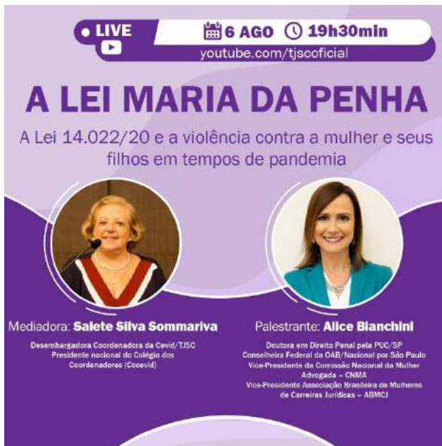
Figura 31 - Live A Lei Maria da Penha

11-8, 18h - Mediadora na Live "violência doméstica, como identificar" - Projeto Formar para Transformar da Cevid.