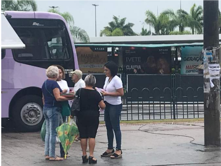
Figura 8 - Ação da Secretaria de Desenvolvimento Social no Ticen, com distribuição das cartilhas da Cevid