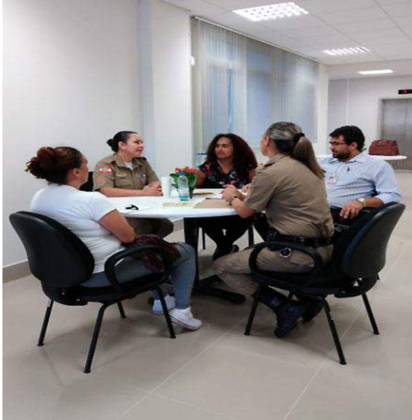
Figura 6 – 16ª Semana da Justiça pela Paz em Casa (comarca de Navegantes)