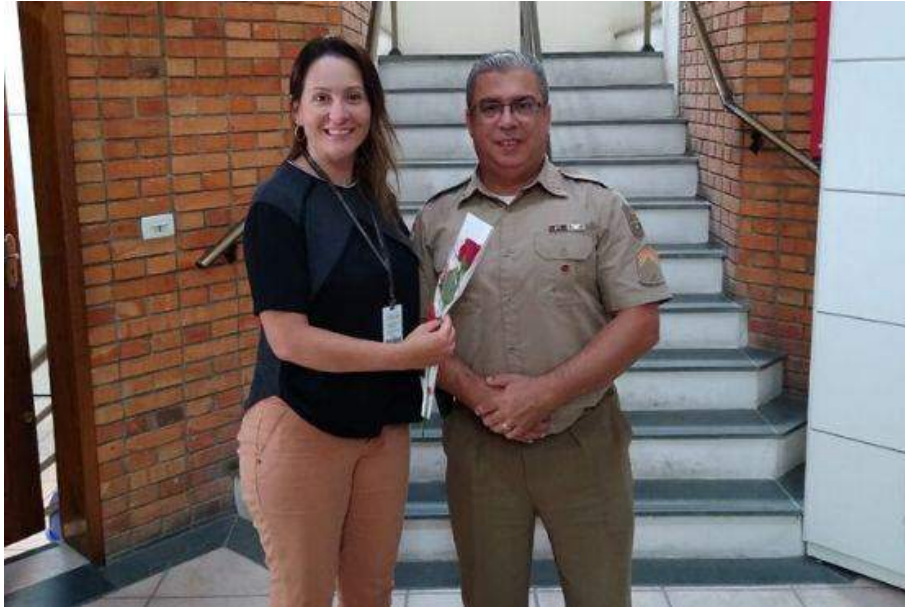
Figura 4 – 16ª Semana da Justiça pela Paz em Casa (comarca de Garopaba)