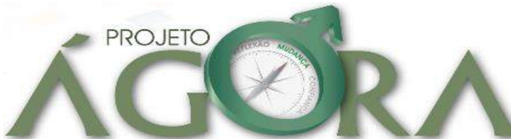
Figura 14 - Identidade Visual do Projeto

O projeto é realizado em parceria com a Universidade Federal de Santa Catarina, e tem por objetivo a criação de Grupos Reflexivos para Homens autores de violência doméstica e familiar contra à mulher. O Grupo Reflexivo é um espaço de diálogo para que os homens possam refletir e repensar as relações de gênero e suas vivências cotidianas, produzindo outros sentidos e significados sobre a construção de masculinidade e sociabilidade masculina. Entre os resultados que podem ser alcançados com tal metodologia, podemos citar a responsabilização dos homens autores da violência, a prevenção de novos episódios da mesma natureza, a desnaturalização da vinculação existente entre masculinidade e violência e a criação de uma rede de atendimento para homens.