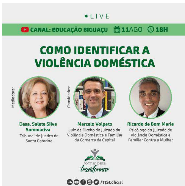
Figura 32 - Live Como Identificar a Violência Doméstica

https://www.tjsc.jus.br/web/imprensa/-/cevid-divulga-live-para-auxiliar-na-identificacao-da-violencia-domestica-ja-na-origem?inheritRedirect=true