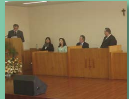
Comarca de Caçador recebe sua Vara Criminal