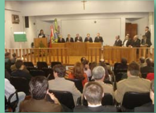
Vara Criminal para a Comarca de São Miguel

As unidades foram instaladas com base na peculiaridade de cada comarca. O Programa de Implantação dos Serviços Judiciários do TJ é responsável pela organização do ambiente de trabalho e obtenção de móveis e utensílios – inclusive de informática, além da capacitação dos funcionários.