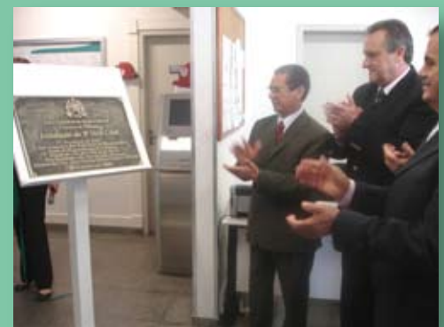
Comarca de Palhoça ganhou sua 3ª Vara Cível