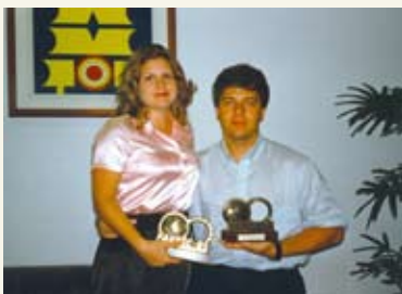
Casal mostra troféu de dupla campeã em 1995

equipe de implantação da Assessoria de Planejamento em 1998, onde atuou por quatro anos. Em 2002, quando foi criada a Diretoria de Informática, foi convidado para gerenciar essa área. Por cinco anos foi diretor, cargo que ocupa atualmente. Aos 37 anos, se sente realizado no trabalho. "Gosto do que faço. Adoro desafios", conta com entusiasmo.