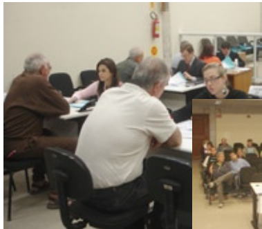
Meta 2 pretende julgar processos que ingressaram até 31 de dezembro de 2005