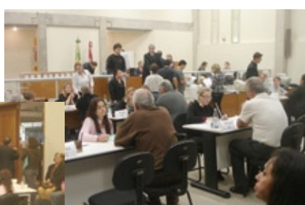
Mutirão do Executivo Fiscal da Comarca de São José, em junho, realizou 90% de acordos