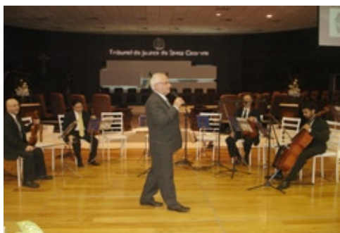
Maestro fez analogias entre uma empresa e uma orquestra