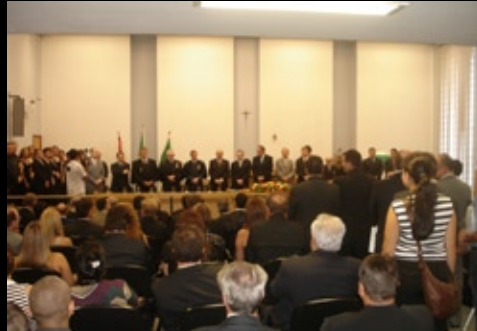
Auditório lotado na instalação da CERC, em 5 de fevereiro de 2009