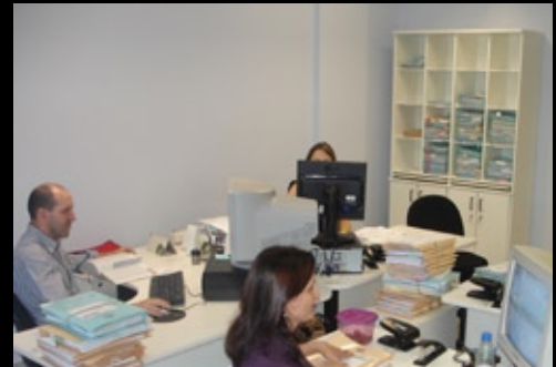
Servidores da secretaria da CERC terão mais trabalho depois que a competência for ampliada