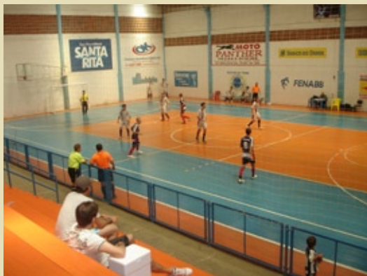
Futebol de salão é uma das modalidades mais disputadas desde o início dos jogos, em 1985

Florianópolis recebeu os XXIV Jogos da Família Forense durante os dias 28 e 30 de outubro. Distribuídos em 16 categorias, nas modalidades coletiva, dupla e individual, servidores do