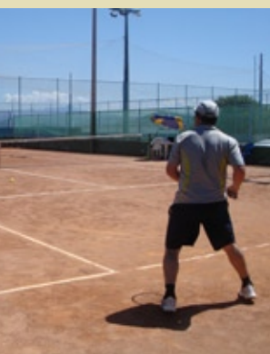
O tênis é uma das modalidades dos Jogos Forense deste ano, que foi disputado na Capital

Florianópolis recebeu os XXIV Jogos da Família Forense durante os dias 28 e 30 de outubro. Distribuídos em 16 categorias, nas modalidades coletiva, dupla e individual, servidores do