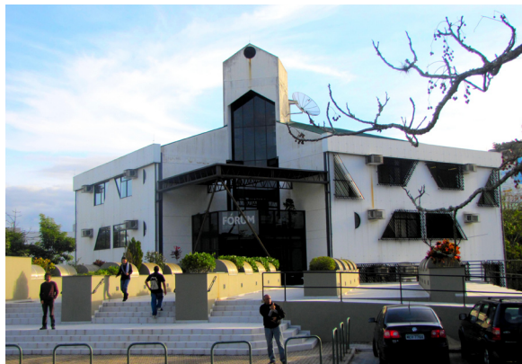
Nova unidade será localizada no Fórum do Norte da Ilha

é que o Juizado receba até 500 ações por mês. Segundo o desembargador Gastaldi Buzzi, coordenador estadual de Juizados Especiais de Santa Catarina, a unidade servirá de experiência piloto para nortear, futuramente, novos juizados em todo o Estado.