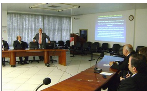
A visita ocorreu na sede da Seccional, em Florianópolis

Nas comarcas, a migração deve estender-se até o final de 2011. O desembargador Jorge Schaefer afirmou que, com isso, será possível introduzir o processo virtual no Estado e passar a trabalhar com a assinatura digital.