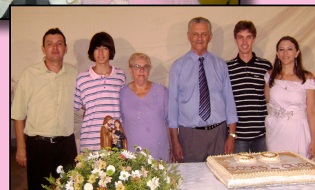
Acima, suas duas afilhadas, e abaixo, Mere com a família nas Bodas de Ouro dos pais