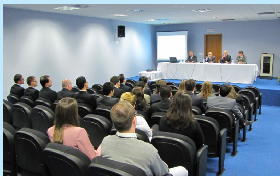
Na aula, o presidente do TJ ressaltou a importância do 1º Grau

“O juiz de 1º Grau é decisivo para mudanças na jurisprudência estadual e, assim, ajuda a promover as mudanças sociais em busca de uma sociedade mais justa”, ensinou o presidente.