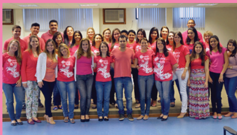
Comarca de São Francisco do Sul