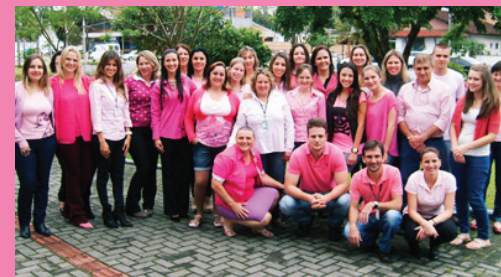
Comarca de Timbó