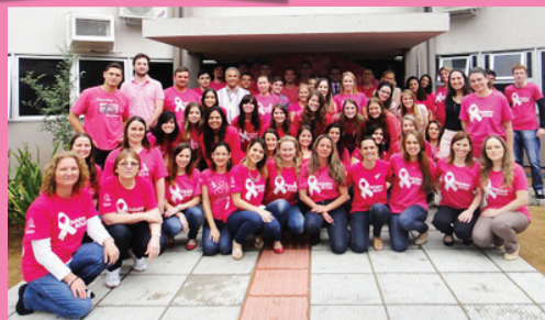
Comarca de Jaraguá do Sul