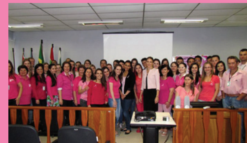
Comarca de Canoinhas