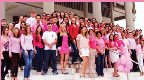
Comarca de Balneário Camboriú