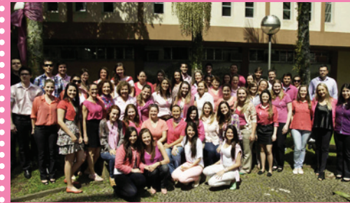
Comarca de Urussanga

O Poder Judiciário demonstrou sua solidariedade ao movimento de prevenção do câncer de mama. Ao longo do mês de outubro, vestiu literalmente a camisa rosa da bem-sucedida campanha. Foram diversas as manifestações, que reuniram magistrados, assessores, servidores e terceirizados na Capital e no Estado.