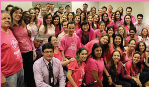
Diretoria de Recursos Humanos do TJSC