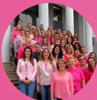
São Bento do Sul