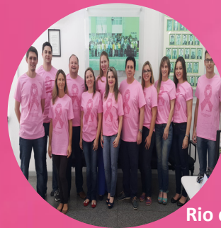
Rio do Sul