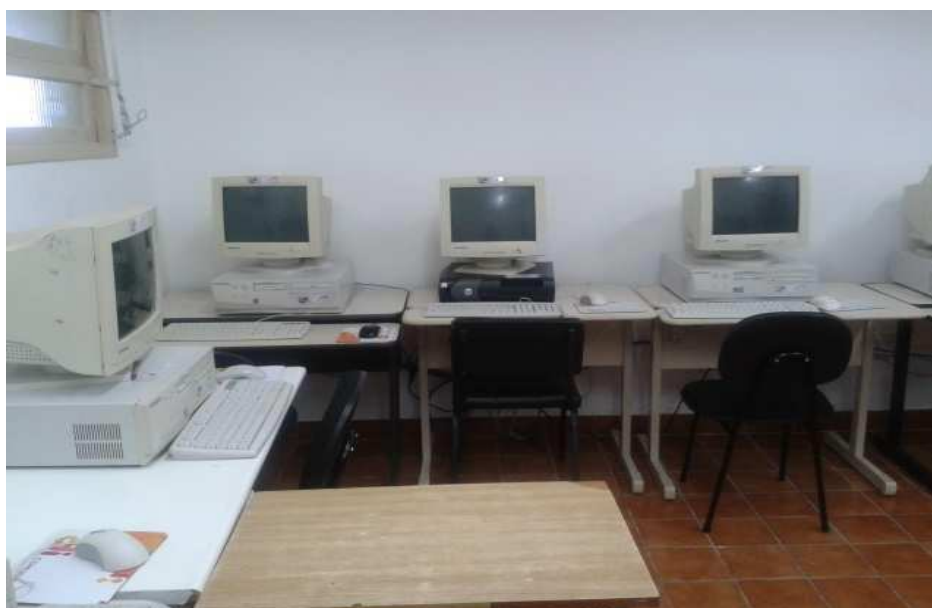
(Sala de informática do centro)