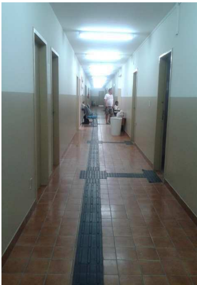
(Interior do Centro de Referência Especializado para População em Situação de Rua de Florianópolis)