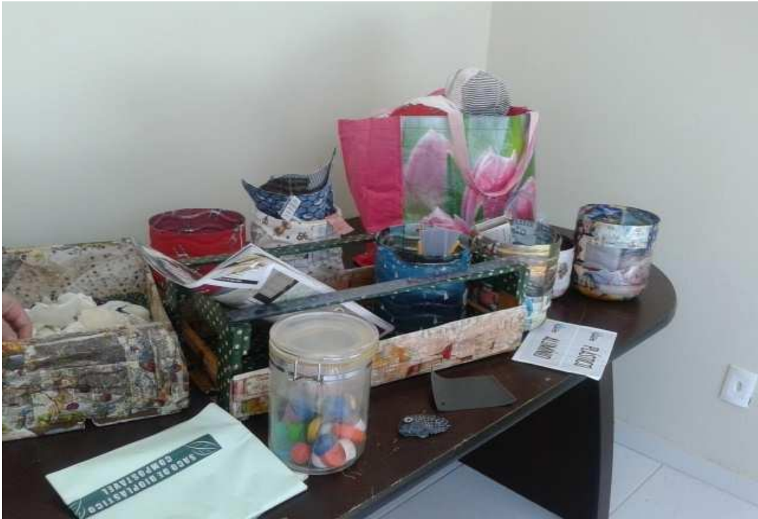
(Materiais utilizados na oficina de artesanato do centro)