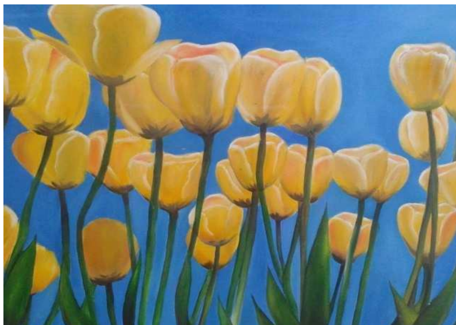
(Obra criada nas oficinas de pintura do centro)