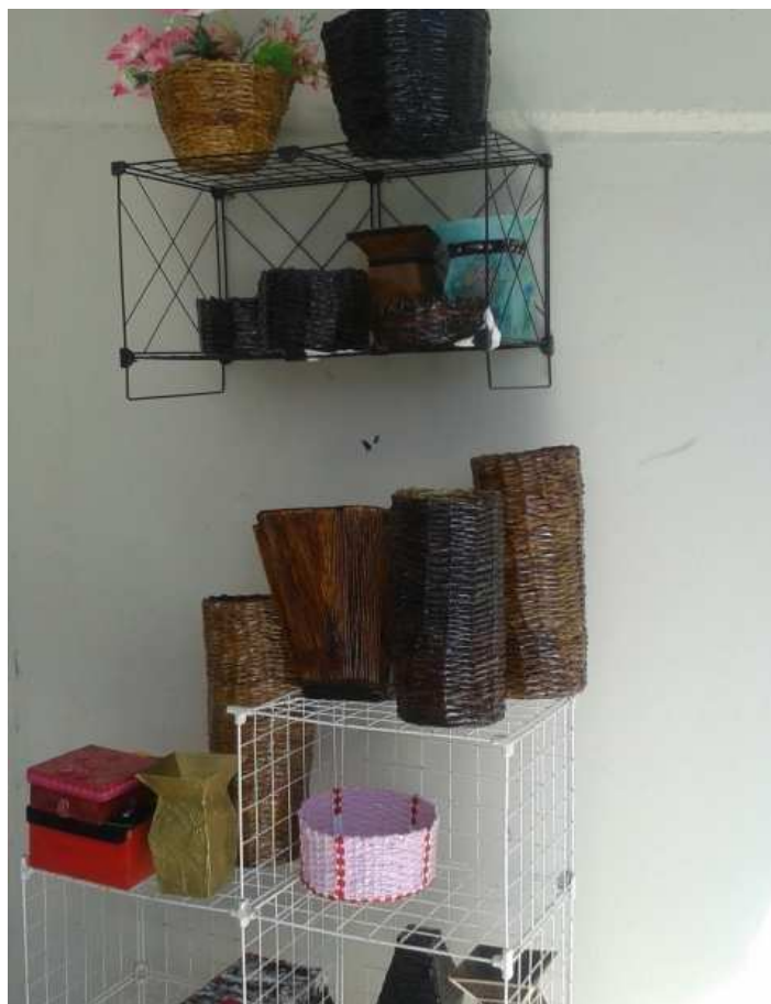
(Artesanato criado pelas pessoas atendidas)