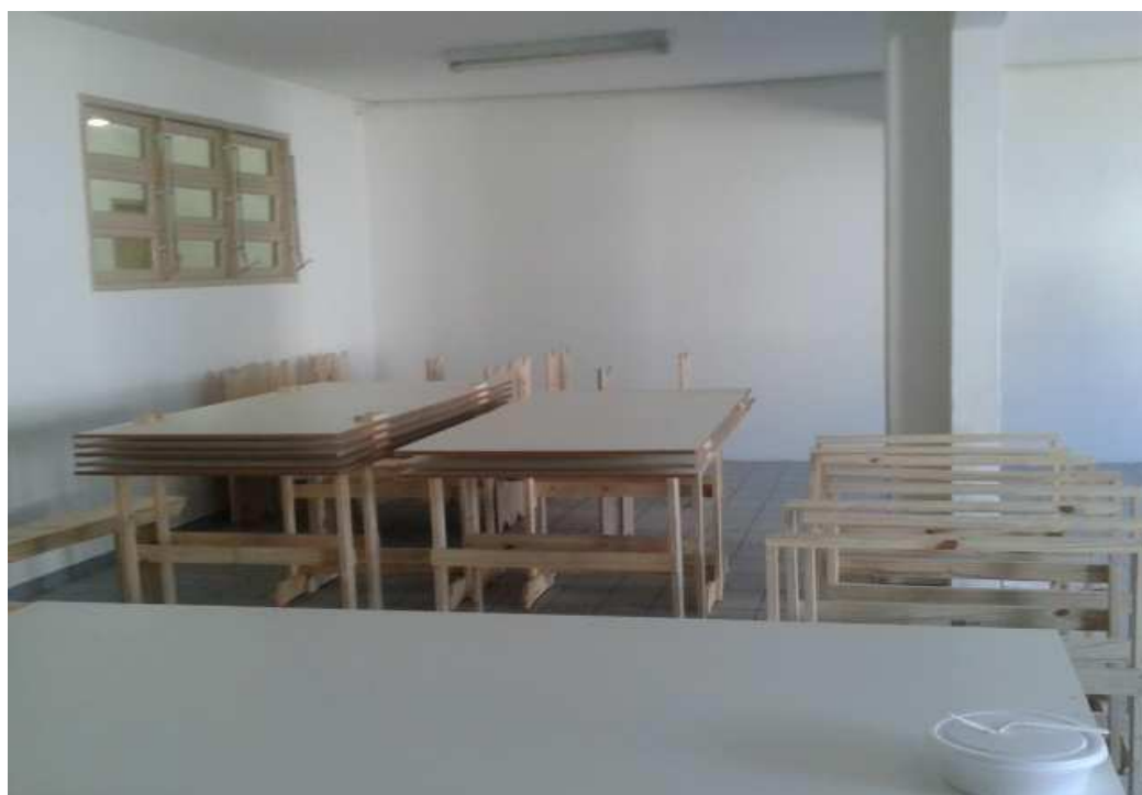
(Novo refeitório do centro)