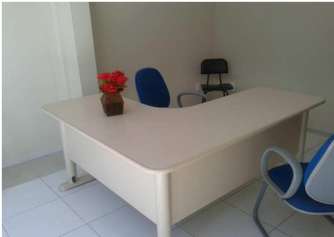
(Sala destinada aos atendimentos especializados – psicossocial - individualizados)