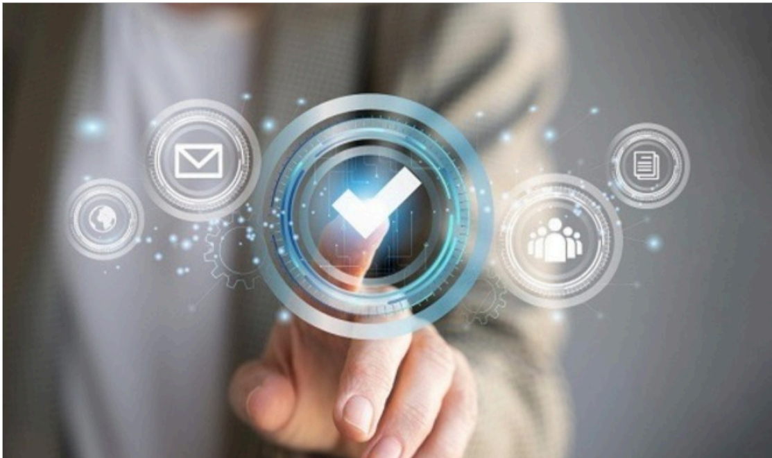
Imagem em destaque

A Comissão Eleitoral designada para realizar as eleições às vagas de membros do Comitê Orçamentário e de Atenção Prioritária ao Primeiro Grau de Jurisdição (COAPPG) e do Comitê de Gestão Estratégica de Pessoas (CGEP), diante do transcurso do prazo sem qualquer impugnação, divulgou as inscrições definitivas.