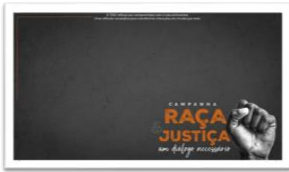
Carrossel no Instagram do PJSC